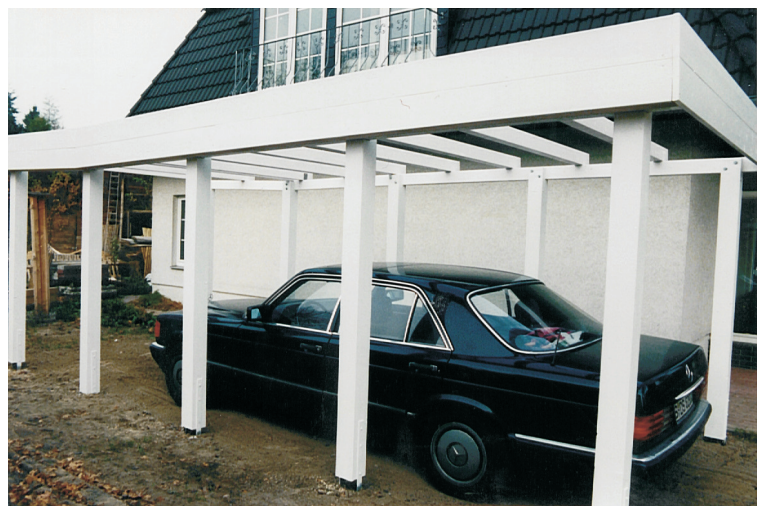
Einzelcarport Flachdach (300 x 700 cm) Leimholz weiß

Die Leimholz-Carports zeichnen sich durch weitgehende Riß- und Verzugsfreiheit aus. Gerade, wenn der Carport farbig insbesondere hell oder weiß angestrichen werden soll, ist Leimholz ideal. Wir verwenden nur erstklassiges Leimholz aus deutscher Produktion. Ein direkter Erdverbau der Pfosten ist hier allerdings nicht möglich. Neben der gebräuchlichen Ankermontage ist aber auch die Montage direkt in ein Betonfundament möglich und sogar statisch besonders stabil.