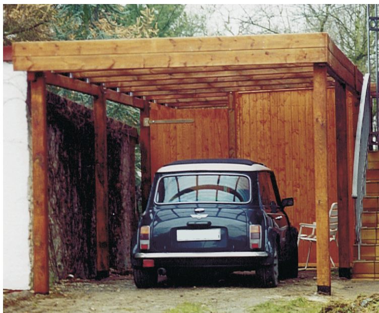
Einzelcarport Flachdach mit Kammer (Dach Lichtplatten) KD Kiefer

Die verschiedenen Größenmodelle ( wie Einzel- Doppel- Anlehn- oder Breitcarport) und unterschiedliche Dachvarianten (wie Pultdach, Flachdach - zur Seite nach hinten oder mittig entwässernd - Gründach oder Satteldach), sowie variierende Blendenmodelle (wie Walmdachblende in unterschiedlicher Eindeckung oder angewalmte oder gerade Blende), und die Kombinationsmöglichkeit aller Carporttypen mit Kammer und Seitenwänden und alles in drei Holzarten gibt Ihnen einen Vorstellung über die Fülle der Alternativen, die wir Ihnen bieten können. Die meisten Typen sind für Reihencarportanlagen geeignet. Und wenn Ihr Wohnwagen oder LKW einen extra hohen Carport braucht ist, das auch kein Problem.